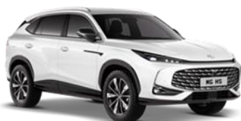
PEARL bijela 500,00 €